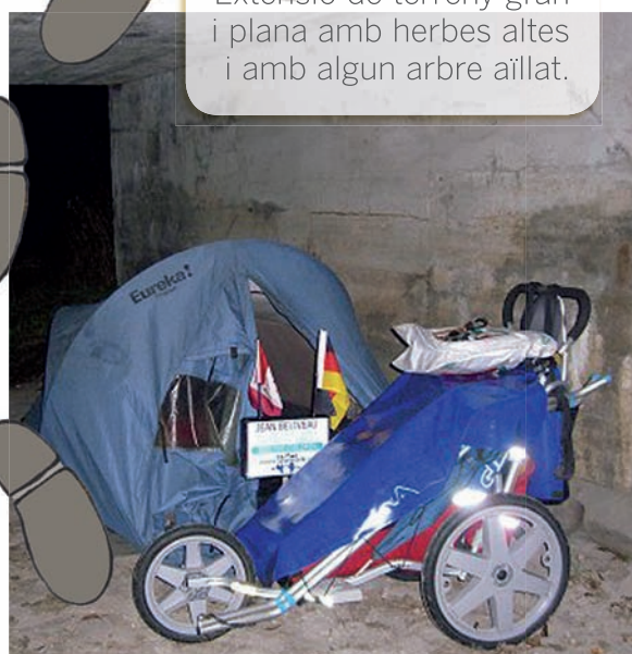
El cotxet i la tenda d'en Jean.

Extensió de terreny gran i plana amb herbes altes i amb algun arbre aïllat.